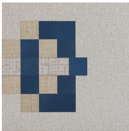
Delar 1 & 2, 2021, 30 x 30 cm, upplaga 3 ex UV-laminerad fine art print på grunderad mdf