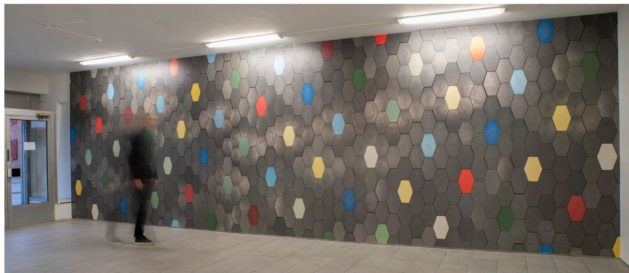
Husmorsmosaik, på Galleri Ping-Pong hösten 2021 9x3 m, tapetprint