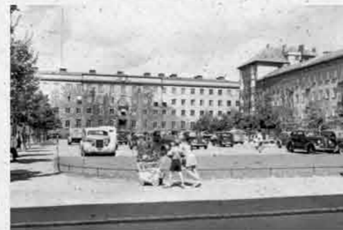
Mån-ön kl. 10-19 Öns kl. 10-21