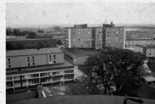
Mån-ön-fre kl. 10-19 Te kl. 13-20