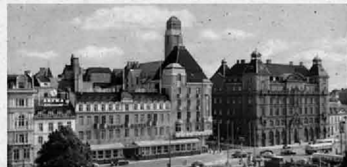
Mån-ön kl. 10-19 Öns kl. 10-21